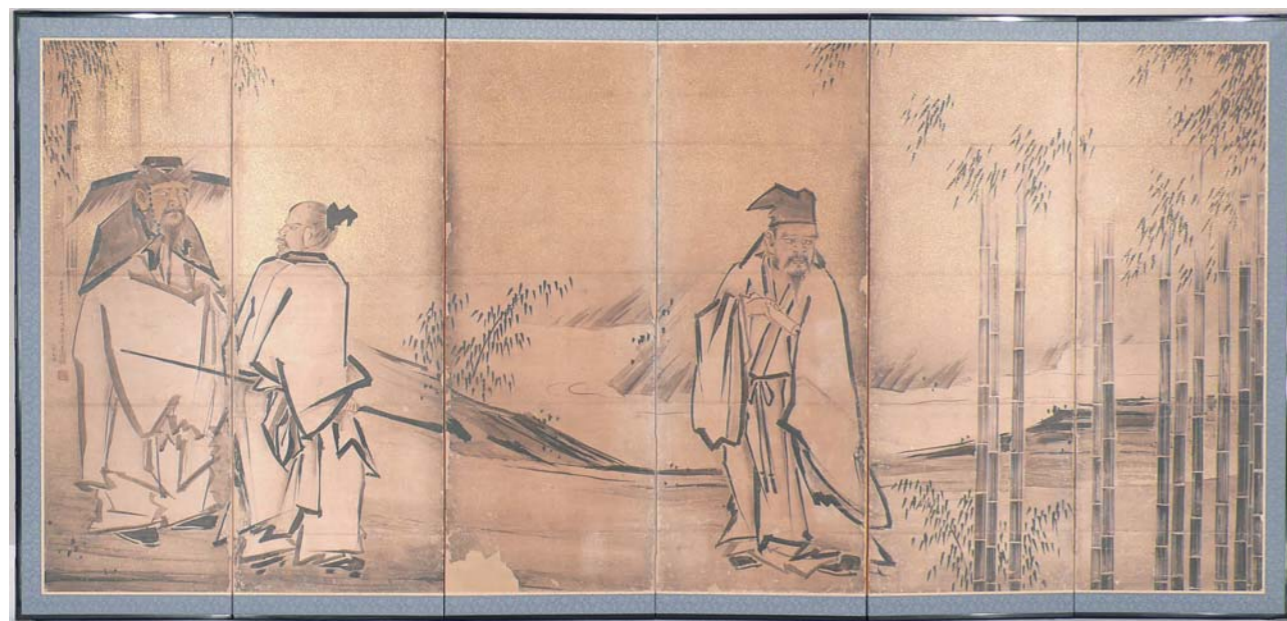
修復後 after restoration