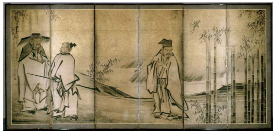
修復前 before restoration