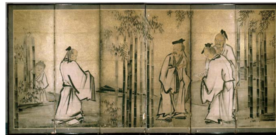
修復前 before restoration