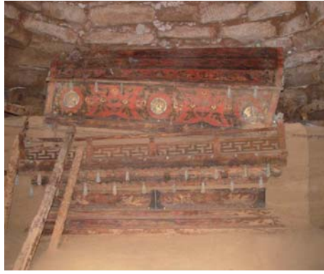
修復前 before restoration